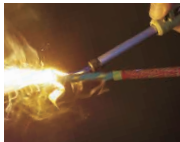
花火・線香の点火