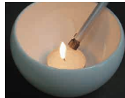
キャンドルの点火