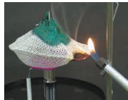
マンツルの空焼き