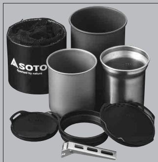
サーモスタック クッカーコンボ SOD-521