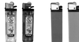
CR-ML-17 (PSC) CR-SPカラード (PSC)