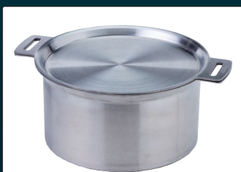
GORA OVEN(ゴラオープン) ST-950D